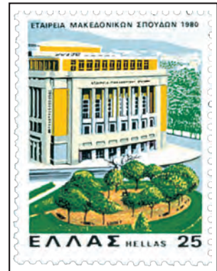
Επετειακό γραμματόσημο της Εταιρείας για τον εορτασμό των 40 χρόνων της (1980)