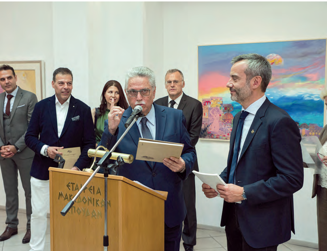
Εγκαίνια έκθεσης, “Η Θεσσαλονίκη στους ζωγράφους”, Πινακοθήκη Ε.Μ.Σ. (2.10.2019)

ρας, η Εταιρεία Μακεδονικών Σπουδών δεν θα μπορούσε να μείνει αμέτοχη. Καθ' όλη τη διάρκεια των διαπραγματεύσεων για τη Συμφωνία των Πρεσπών που διεξήγαγε η Ελληνική Διπλωματία με το κράτος των Σκοπίων, η Εταιρεία βρισκόταν σε επαγρύπνηση και αξιολογούσε τα διαδραματιζόμενα. Από τη στιγμή που δημοσιεύθηκαν τα συμφωνηθέντα μεταξύ των δύο πλευρών, γνωστοποίησε τη θέση της με Ψηφίσματα, Ημερίδες, Συνεντεύξεις,