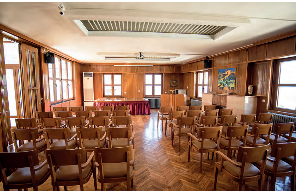
Η Αίθουσα Εκδηλώσεων του Δικτύου Επικοινωνίας Ομογενών Μακεδόνων (Δ.Ε.Ο.Μ.)