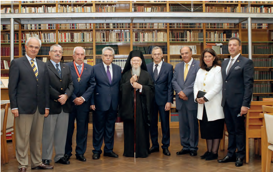
Το Δ.Σ. της Εταιρείας κατά την επίσκεψη του Οικουμενικού Πατριάρχη κ.κ. Βαρθολομαίου στην Εταιρεία (30.9.2018)