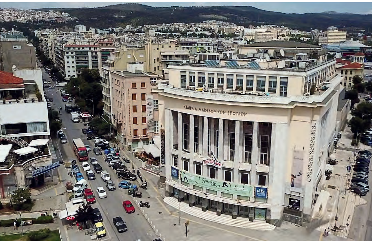
Το κτιριακό συγκρότημα της Εταιρείας Μακεδονικών Σπουδών

Τέλος, αναλαμβάνει άμεσα πρωτοβουλίες σε ολόκληρη τη Μακεδονία για τον σχεδιασμό και την οργάνωση Επιστημονικών Προγραμμάτων με κεντρικό θέμα την ανάδειξη της θυσιαστικής προσφοράς, του ορθόδοξου φρονήματος και της Ιδέας περί Ελευθερίας των Αγωνιστών του '21 (200 χρόνια από την Ελληνική Επανάσταση, 1821-2021).