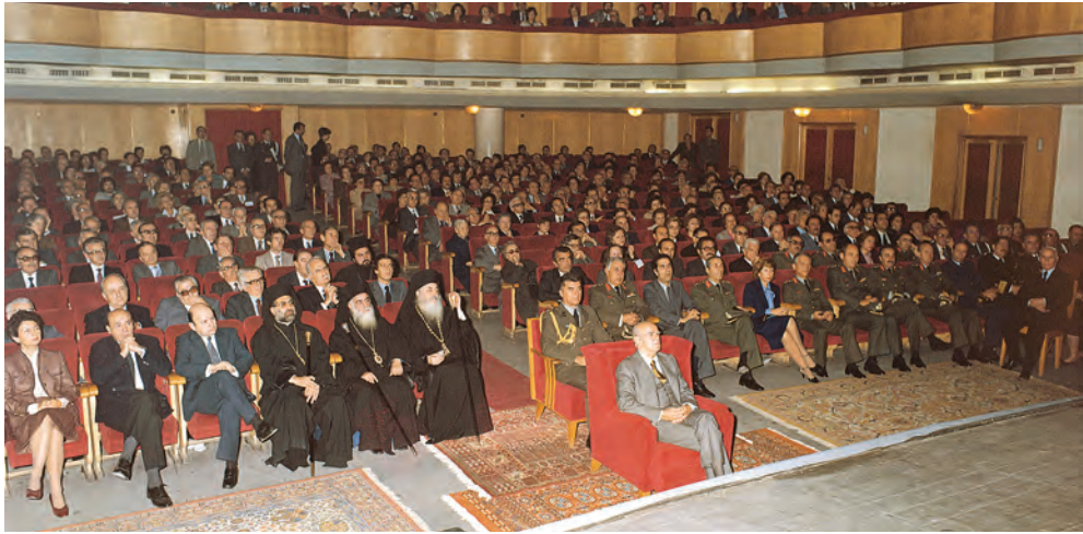
Ο Κων. Γ. Καραμανλής παρών στον πανηγυρικό εορτασμό των 40 χρόνων της Ε.Μ.Σ. (1980)