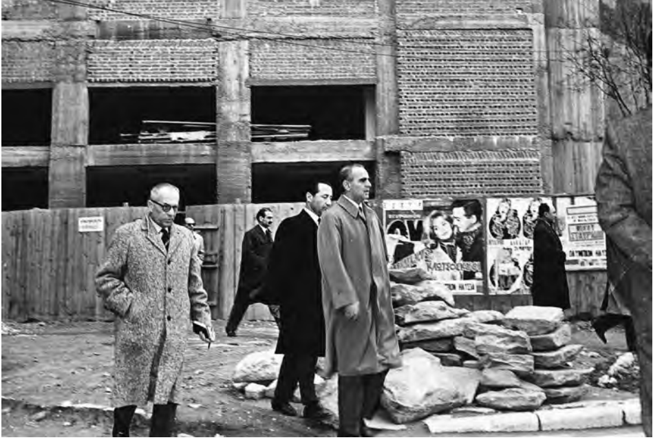
Ο Πρωθυπουργός Κων. Γ. Καραμανλής επιθεωρεί τις εργασίες στο ανεγειρόμενο Θέατρο της Εταιρείας

την ίδρυσή της, στρατηγικός στόχος της ήταν –και παραμένει εσαεί– η υπεράσπιση και ανάδειξη της ελληνικότητας της Μακεδονίας. Τον στόχο αυτό υπηρετεί σταθερά με το επιστημονικό της κύρος, με εκδόσεις, ερευνητικά Προγράμματα, Συνέδρια, Ημερίδες και πνευματικές εκδηλώσεις, προσφέροντας, ως επιστημονικό Ίδρυμα, με τα ικανά στελέχη της και τη στήριξη των εταίρων της, πολλές φορές αφανώς, πολύτιμη βοήθεια στην Ελληνική Πολιτεία για την αντιμετώπιση των εθνικών θεμάτων. Το σημαντικό εθνικό και πνευματικό της έργο αναγνώρισε και τίμησε ποικιλοτρόπως κατά καιρούς η επίσημη Ελληνική Πολιτεία. Μέλη της είναι επιφανείς κάτοικοι