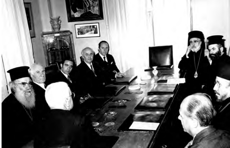
Ο Αρχιεπίσκοπος Αμερικής Ιάκωβος συσκέπτεται με το Διοικητικό Συμβούλιο της Εταιρείας (13.4.1973)