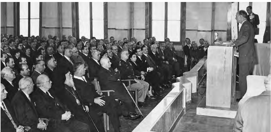
Ο Παναγιώτης Κανελλόπουλος, καθηγητής και ακαδημαϊκός, στο βήμα της Εταιρείας (1952)

την ίδρυσή της, στρατηγικός στόχος της ήταν –και παραμένει εσαεί– η υπεράσπιση και ανάδειξη της ελληνικότητας της Μακεδονίας. Τον στόχο αυτό υπηρετεί σταθερά με το επιστημονικό της κύρος, με εκδόσεις, ερευνητικά Προγράμματα, Συνέδρια, Ημερίδες και πνευματικές εκδηλώσεις, προσφέροντας, ως επιστημονικό Ίδρυμα, με τα ικανά στελέχη της και τη στήριξη των εταίρων της, πολλές φορές αφανώς, πολύτιμη βοήθεια στην Ελληνική Πολιτεία για την αντιμετώπιση των εθνικών θεμάτων. Το σημαντικό εθνικό και πνευματικό της έργο αναγνώρισε και τίμησε ποικιλοτρόπως κατά καιρούς η επίσημη Ελληνική Πολιτεία. Μέλη της είναι επιφανείς κάτοικοι