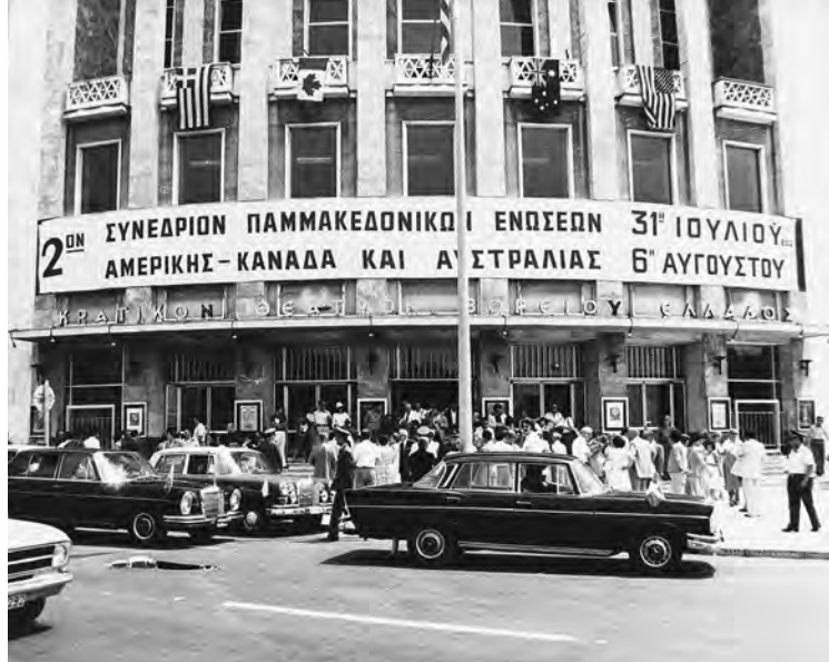
Το 2ο Συνέδριο Παμμακεδονικών Ενώσεων Αμερικής - Καναδά και Αυστραλίας στο Θέατρο της Εταιρείας (1977)