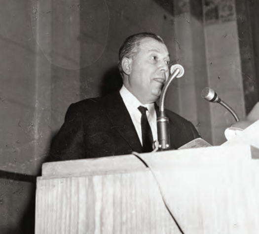
Ο ιστορικός Πολυχρόνης Ενεπεκίδης ομιλεί στην Εταιρεία (4.2.1970)

της Θεσσαλονίκης, ακαδημαϊκοί, καθηγητές Πανεπιστημίου, επιστήμονες, επιχειρηματίες, ανώτατοι στρατιωτικοί και κρατικοί λειτουργοί.