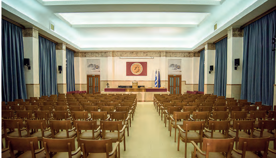
Η Αίθουσα Διαλέξεων