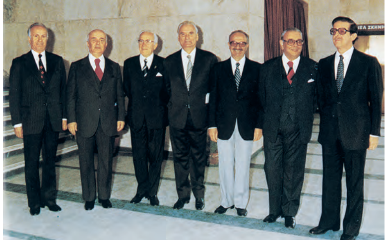
Το Διοικητικό Συμβούλιο της Εταιρείας κατά τον εορτασμό των 40 χρόνων της (1980)