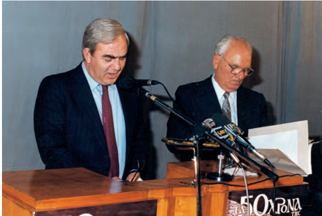
Στο βήμα της Εταιρείας ο υπουργός Μακεδονίας-Θράκης Γιώργος Τζιτζικώστας