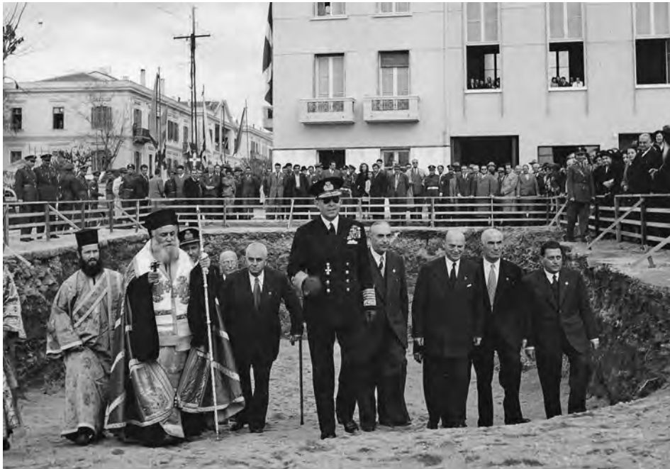
Τελετή θεμελίωσης του Θεάτρου της Ε.Μ.Σ., παρουσία των Βασιλέων Παύλου και Φρειδερίκης (19.11.1951)

Η Εταιρεία Μακεδονικών Σπουδών ιδρύθηκε στη Θεσσαλονίκη τον Απρίλιο του 1939 από επίλεκτα μέλη της κοινωνίας της Θεσσαλονίκης, τα οποία ανήκαν στον πνευματικό και εμπορικό κόσμο και, έκτοτε, η λειτουργία της είναι αδιάκοπη. Από