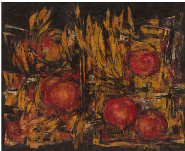
Κλειώ Νάτση, Ρόδια, 1996

Κτίριο Διοικήσεως, Εθνικής Αμύνης 4, 1ος όροφος.